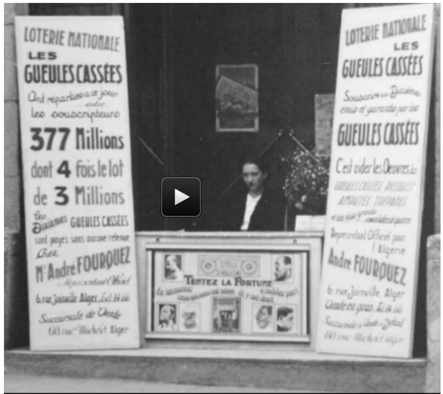
Document 1 : ( Doc 1 et 3 : Extraits du site de l'association des gueules cassées)